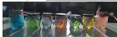
例) アロマポットづくり