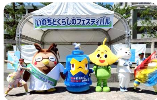
↑着ぐるみとクリニックラウンが記念撮影

5/17(日)港南ふれあい公園・区役所・ケアプラザを会場に開催された「いのちとくらしのフェスティバル」が開催されました。医師、薬剤師、看護師といった医療関係、高齢者・障害児者支援をしている福祉関係、更にドクターカーや起震車などもあり、親子が楽しめるイベントになりました。ケアプラザも絆マフ・視覚障害についてのブースを出し、触ったり、学んだりでたくさんの方に知っていただけました。