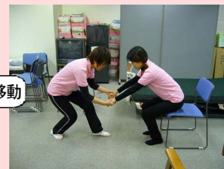
要介護者の両手を、「ありがとう」とお辞儀をするような形に引きます。