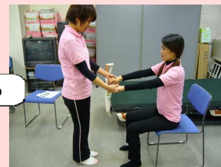
介助者は要介護者の前に立ち、要介護者に手を握ってもらいます。