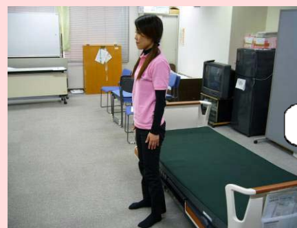
足底に体重がかかり、安定する。