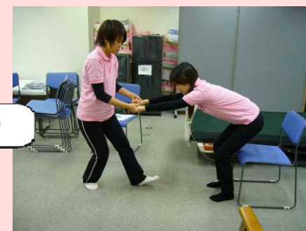
お尻が上がったら、上の方にあげます。