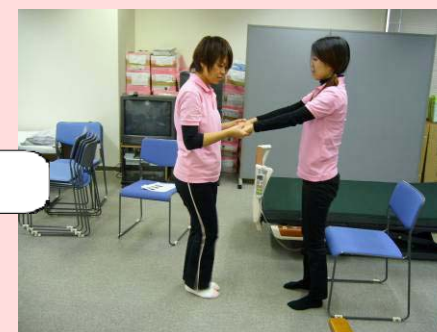
立ち上がりました。