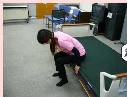
頭を前に倒し、前の方(頭と足)へ体重が移動。