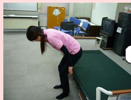
足への体重移動後、足全体で伸びあがり、頭をあげて体を起こしていく。