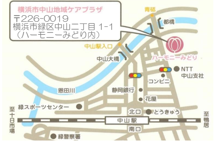
< ハーモニーみどり1階 中山駅より徒歩 約7分 >