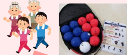
さかえすたボッチャ部 第2・第4回 SAKAESTAで 活動中です☆