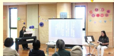
歌の会 COCORO ころろ