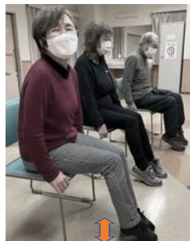
両足かかとを上げ下げ する