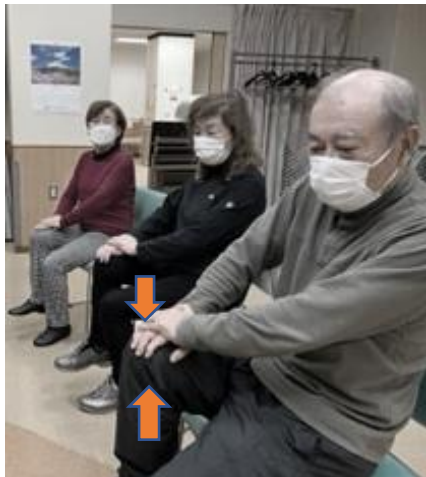
上げた右足ももに対して、 逆らうように両手で右足もも を下に押す