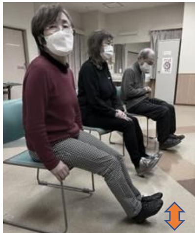
両足つま先を上げ下げする