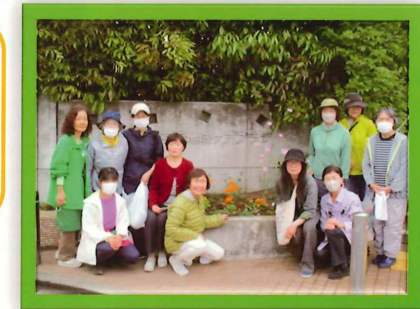
当日、ご参加いただいた皆さんで、お花をバックに記念写真♪