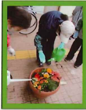
たっぷりとお水をあげます