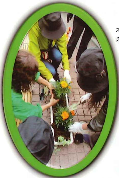
オレンジ・緑・黄色、彩を 考えながら植えました。

当日はオレンジ色のマリーゴールドを基調にした寄せ植えに挑戦!! ケアプラザの玄関エントランスに素敵な寄せ植えができました。このオレンジ色に彩られた花々が、ケアプラザにお越しくださる地域の皆さんを、温かく見守っていきます。