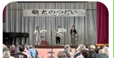
フェリス女学院吹奏楽部

いずみ野地域ケアプラザは「押し買い」をテーマとした寸劇を予定していましたが、諸事情により中止となり、予定の一部の「クーリングオフ制度」に関する説明とクイズのみの実施となりました。生鮮食品も訪問販売の対象となることに驚く声があがり、制度への理解を深める良い機会となりました。