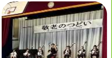
津軽三味線の演奏