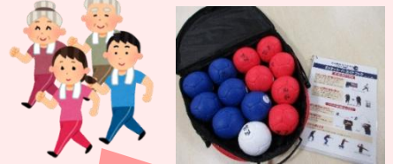
さかえすたボッチャ部 第2・第4回 SAKAESTAで 活動中です☆