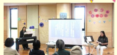
歌の会 COCORO ころろ