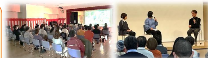
「オレンジ・ランプ」上映

当ケアプラザでは、令和4年6月より横浜市の認知症施策である「チームオレンジ」に参画し、若年性認知症当事者の会を毎月開催してきました。4月より第2木曜日の11時～13時の予定で『カフェ・リアン』をオープンします。これからも当事者が活躍できる居場所づくりを支援させていただきます。