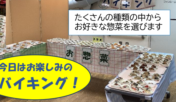
たくさんの種類の中から好きな惣菜を選びます