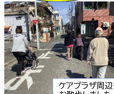
ケアプラザ周辺をお散歩しました！