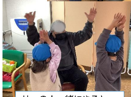
せ～の！一緒にやるとこんなに腕が上がります