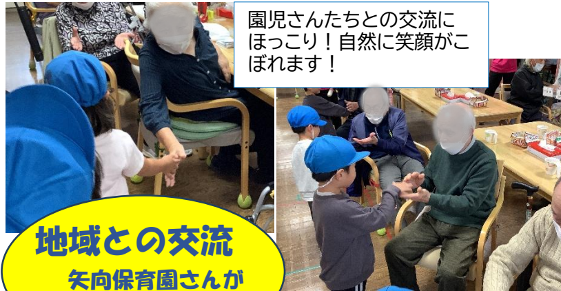
園児さんたちとの交流にほっこり！自然に笑顔がこぼれます！