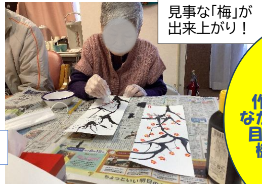
見事な「梅」が出来上がり！